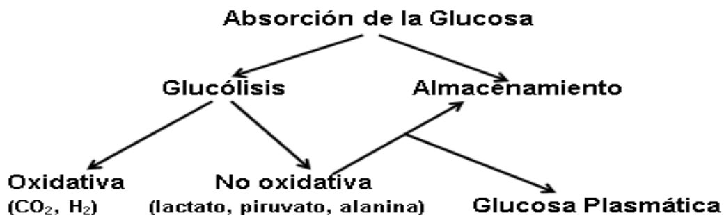
Figura 2. Rutas de la eliminación de la glucosa postprandial

Los valores promedio de glucosa en plasma arterial durante un período de 24 horas son de aproximadamente 90 mg/dL, con una concentración máxima que en general no exceden de 165 mg/dL como por ejemplo después de la ingestión de una comida 7 , permaneciendo por encima de 55 mg/dL después del ejercicio 7 o de un ayuno moderado hasta de 60 horas 9 .